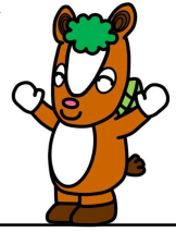
飯能市イメージキャラクター 夢馬 (むーま)

赤ちゃんもあそべるおもちゃを用意しています。 たくさんからだを動かしてあそびませんか？ 手あそびや絵本のよみきかせもしています！おまちしています。