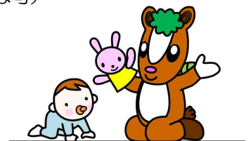
飯能市イメージキャラクター 夢馬 (むーま)