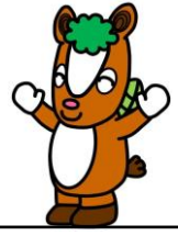
飯能市イメージキャラクター 夢馬 (むーま)

赤ちゃんもあそべるおもちゃを用意しています。 たくさんからだを動かしてあそびませんか？ 手あそびや絵本のよみきかせもしています！おまちしています。