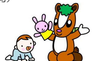
飯能市イメージキャラクター 夢馬 (むーま)